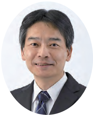
がんセンター 第二外科 部長