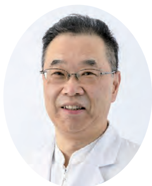
がんセンター 脳神経外科 部長